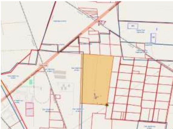
Fuente: Sistema de Infraestructura de Datos Espaciales Catastro de Querétaro, de la Dirección de Catastro del Estado de Querétaro.