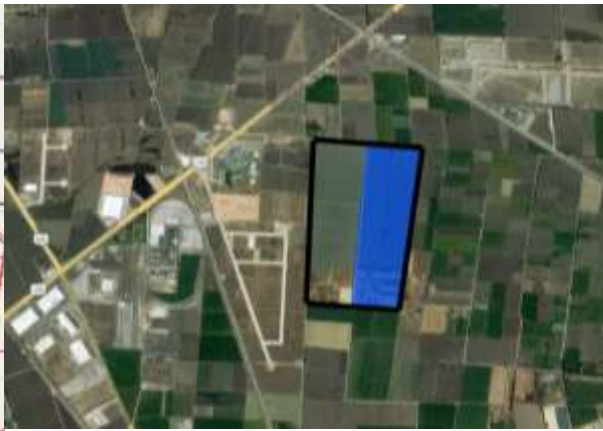
Se indica con línea negra el polígono del predio amparado con la Escritura 12,975 con superficie de 88.000 Has., y con polígono azul la superficie de 44-77-74.18 Has., que es motivo de la presente.